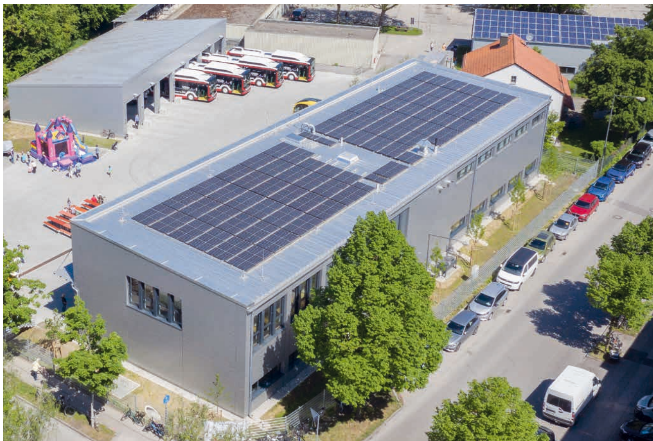
Momentan betreiben die Stadtwerke Dachau über ein Dutzend Photovoltaik-Anlagen im Stadtgebiet, wie hier auf ihrem neuen Busdepot.