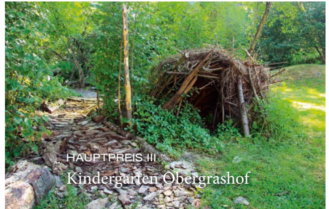
HAUPTPREIS III Kindergarten Obergrashof