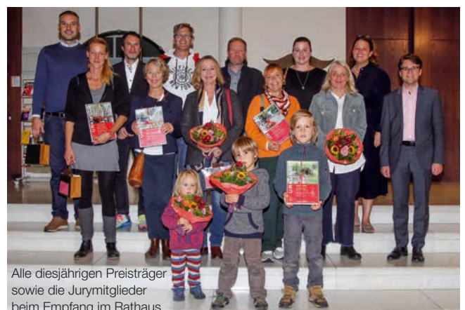
Alle diesjährigen Preisträger sowie die Jurymitglieder beim Empfang im Rathaus.

Herzlichen Glückwunsch allen Preisträgerinnen und Preisträgern – und allerbesten Dank natürlich auch an alle, die beim Wettbewerb mitgemacht und kinderfreundliche Gärten angelegt haben, aber es nicht unter die vier Bestplatzierten geschafft haben. ■