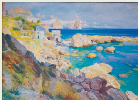
Zauberhaftes Capri, Ausstellung bis 12.03.2023 in der Gemäldegalerie