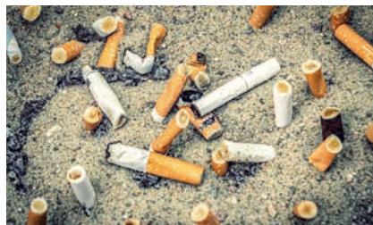
So bitte nicht – denn Kippen gehören in den Restmüll!

Zigarettenkippen enthalten Schadstoffe, die Boden und Wasser erheblich belasten: Bereits eine Zigarettenkippe in einem Liter Wasser tötet Fische; in Süßwasser dauert es rund 15 Jahre, bis die Kippen vollständig zerfallen. Immer wieder werden Zigarettenstummel auch im Magen-Darm-Trakt von Fischen,