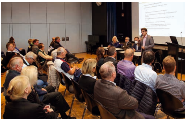
Zum ersten Erörterungstermin des Bebauungsplanverfahrens kamen circa 80 Interessierte.

Sie ist zweifellos das größte Bauprojekt der vergangenen und kommenden Jahrzehnte in Dachau: die Umwandlung des ehemaligen MD-Geländes in ein neues Stadtquartier. Auf einem Erörterungstermin im September wurde der aktuelle Entwurf des Bebauungsplans der Öffentlichkeit vorgestellt. Außerdem konnten Bürgerinnen und Bürger Fragen stellen und Stellungnahmen abgeben.