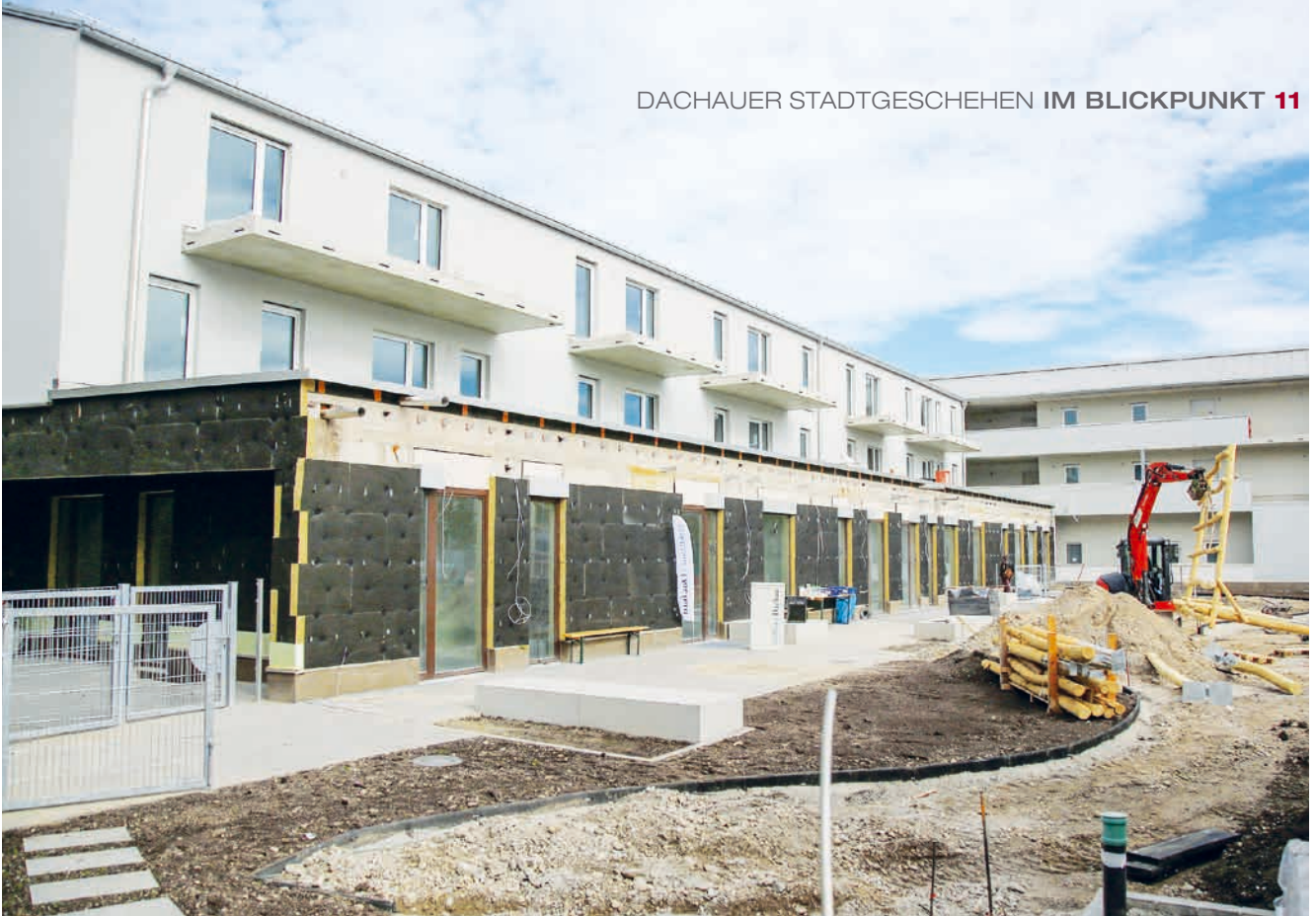
Das neue Gebäude der Stadtbau GmbH am Amperweg: Mitte Oktober haben nur noch die Balkone, Teile der KiTa-Fassade und die Außenanlagen gefehlt.