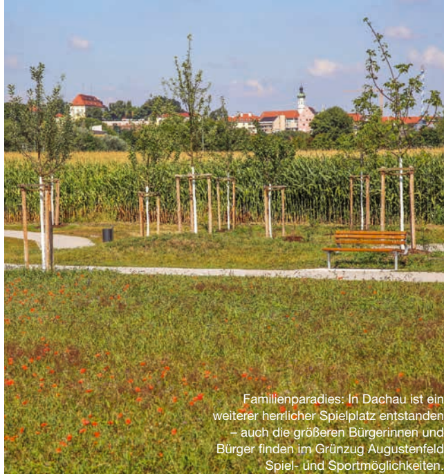
Familienparadies: In Dachau ist ein weiterer herrlicher Spielplatz entstanden – auch die größeren Bürgerinnen und Bürger finden im Grünzug Augustenfeld Spiel- und Sportmöglichkeiten.

Neben den genannten Einrichtungen laden zahlreiche Sitzgelegenheiten zum Verweilen und Entspannen ein, unter anderem ein kleines Theatron aus Natursteinblöcken. Der Kinderspielplatz verfügt über ein buntes Potpourri an Kinderbelustigungsgerätschaften: Rutschenturm, Kletterlandschaft, Tampenschaukel, natürlich auch ein Sandspielbereich und sogar ein Wasserlauf mit zwei Pumpen. Im Grünzug wurde zudem eine zentrale, durchgängige Blumenwiese mit regionaltypischen Blumen angesät, die vielen Insekten Nahrung