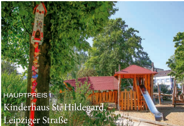
HAUPTPREIS I Kinderhaus St. Hildegard, Leipziger Straße

Heuer standen Dachaus Kleine im Fokus des beliebten städtischen Wettbewerbs „Blumen- und Gartenschätze“ – das Motto lautete „Ein Garten für Kinder – Natur von klein auf erleben“. Im Oktober wurden die Preisträger bekannt gegeben und bei einem Empfang im Rathaus geehrt.