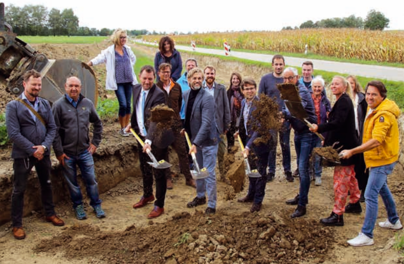
Voller Einsatz aller Beteiligten beim offiziellen Spatenstich – im Hintergrund ist bereits die Trasse des neuen Radwegs zu erkennen.