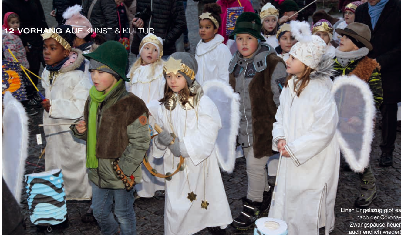
Einen Engelszug gibt es nach der Corona-Zwangspause heuer auch endlich wieder!