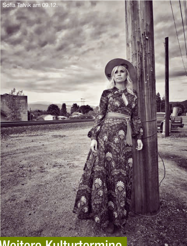
Sofia Talvik am 09.12.