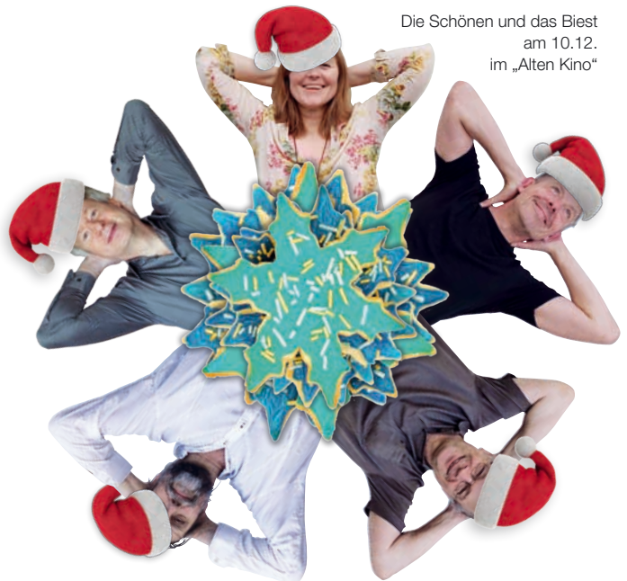
Die Schönen und das Biest am 10.12. im „Alten Kino“

So reich beschert ziehen uns die Rentiere nun in die Sudetenlandstraße zum „Alten Kino“ (Musikheim der Dachauer Knabenskapelle), wo einen Tag später, am 10.12. ab 20 Uhr, schon Die Schönen und das Biest auf weihnachtlich gestimmte Gäste lauern, um ihnen eine „etwas andere Prozedur an Weihnachten“ angedeihen zu lassen. Wer die humorvollen und skurrilen Musiker kennt, der weiß: Es wird lustig.