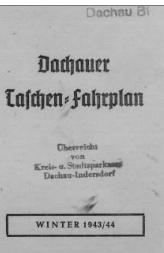
Busfahrplan / Bus timetable 1943/44

Concentration camp prisoners were forced to build an SS residential estate here on the former 'Theodor-Eicke-Platz', which comprised of apartments, a bakery, general store, inn, and post-office branch. To 'foster camaraderie' the Dachau SS founded a 'community house' with various rooms for social events.