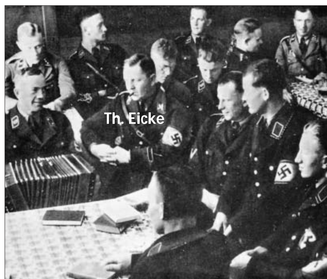
SS-Siedlung am Eickeplatz / SS residential estate on Eickeplatz