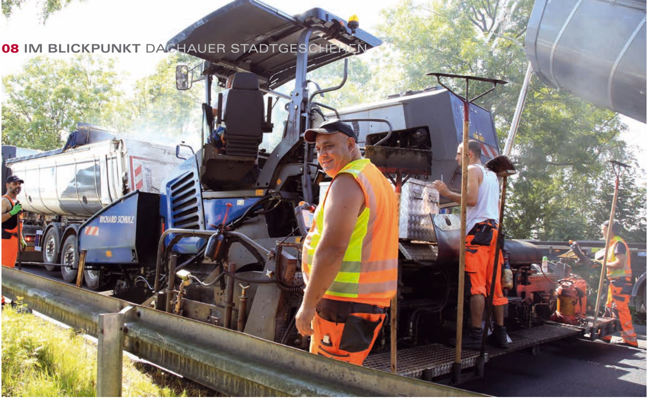
Einsatz mit schwerem Gerät: In der Schleißheimer Straße wurde lärmindernder Asphalt aufgetragen.

» 21. UND 22. JUNI: Schlechtes Timing, liebes Wetter: Bei den Konzerten von „Black Country, New Road“ und Fatoumata Diawara auf dem Rathausplatz schüttet es wie aus Kübeln. Dafür herrschte immerhin beim Jazz in allen Gassen (07.06.), dem Konzert von Mehnersmoos (16.06.) und dem Barockpicknick (20.07.) akzeptables Wetter.