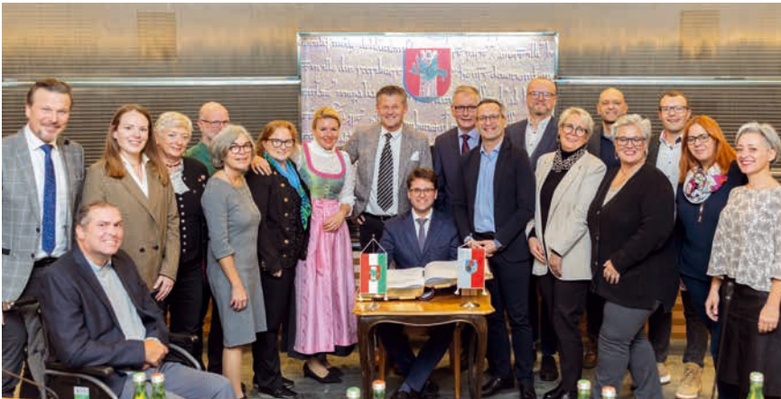
Mit ganz viel Herzlichkeit wurde die Dachauer Delegation in Klagenfurt empfangen.

Vertretern der Dachauer Stadtratsfraktionen und fünf Musikerinnen und Musikern der Stadtkapelle Dachau bestehende Delegation mit herzlichen Worten.