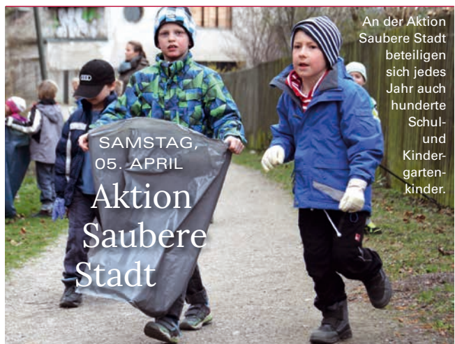
An der Aktion Saubere Stadt beteiligen sich jedes Jahr auch hunderte Schul- und Kindergartenkinder.