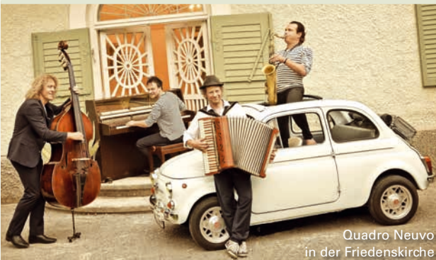
Quadro Nuevo in der Friedenskirche

15.03., 20 Uhr: d’BavaResi – Bayerische Hitz und Witz , Friedenskirche, VVK Ticketino u. Naturkostinsel, 23/20 €