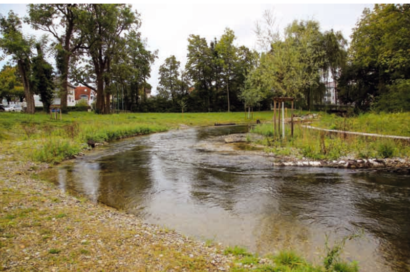
Renaturiertes Flüsschen: Hier darf die Würm sich durch einen kleinen Park schlängeln.