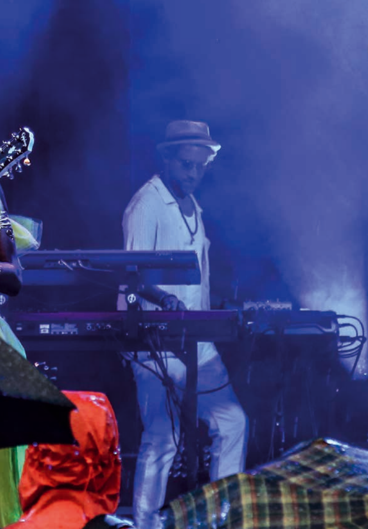
Musikhören unterm Regenschirm: Bei zwei Konzerten auf dem Rathausplatz goss es in Strömen – wie hier bei Fatoumata Diawara.