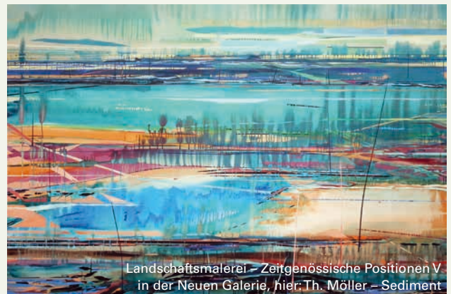
Landschaftsmalerei – Zeitgenössische Positionen V in der Neuen Galerie, hier: Th. Möller – Sediment

02.03., 13-18 Uhr: 3. Kinderball, FG Dachau , L.-Thoma-Haus, weitere Infos: fg-dachau.de