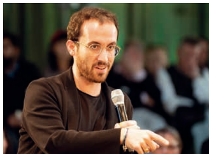
Igor Levit übersiedelte 1995 als Achtjähriger von Russland nach Hannover.

Igor Levit wurde 1987 in Nizhni Nowgorod geboren, im Alter von acht Jahren kam er mit seiner Familie nach Deutschland. Sein Klavierstudium an der Hochschule für Musik, Theater und Medien Hannover absolvierte er mit der höchsten Punktzahl in der Geschichte des Instituts. Es begann eine steile Karriere, heute gilt Igor Levit als einer der besten Pianisten der Welt.