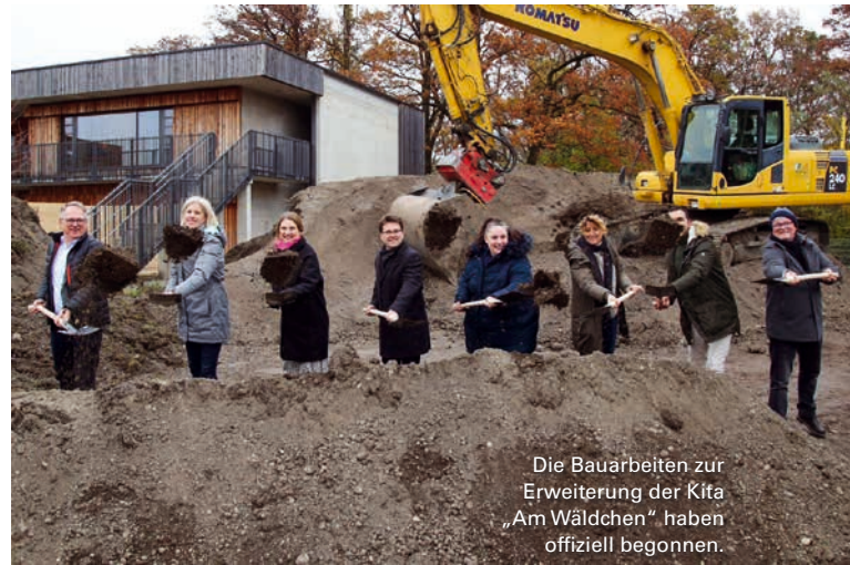
Die Bauarbeiten zur Erweiterung der Kita „Am Wäldchen“ haben offiziell begonnen.

Die infrastrukturellen Einrichtungen im Bestandsgebäude – Eingang, Treppe, Küche, Müllraum, Heizung und Trinkwasseranschluss – sind bereits von Anfang an auf den zweiten Bauabschnitt vorbereitet. Das heißt, der Bestand und die