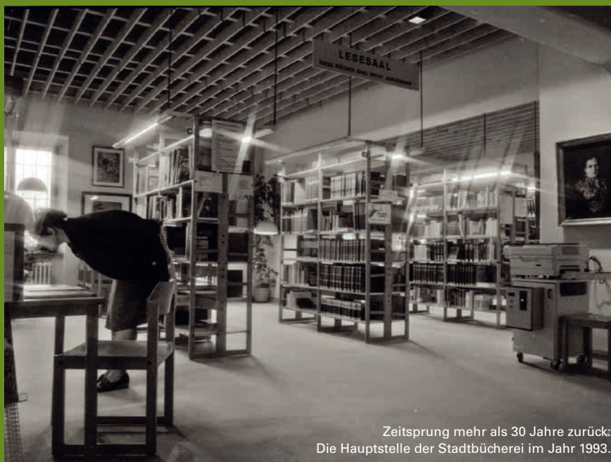
Zeitsprung mehr als 30 Jahre zurück: Die Hauptstelle der Stadtbücherei im Jahr 1993.

→ Die ausführliche interessante Historie der Stadtbücherei – inklusive vieler Fotos aus den letzten Jahrzehnten – finden Sie auf dachau.de/50jahrestadtbuecherei .