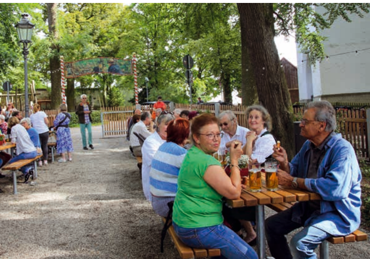
Gemütlichkeit hat einen Namen: Der von der Stadt gebaute „Biergarten am Wasserturm“ eröffnete im Juli.

» 10. AUGUST: Bei herrlichem Wetter brechen die schönsten Tage in Dachau an: jene des Volksfests. Beim traditionellen Aufzug säumen Tausende die Straßen. An einigen Tagen ist es leider etwas zu heiß. Die diesjährige Bilanz: Etwa 300.000 Besucher kamen. Das BRK musste weniger Patienten behandeln, nämlich 270 statt ansonsten circa 350. Die Polizei registrierte mit 40 Anzeigen einen leichten Rückgang. Der älteste Besucher war 102 Jahre alt.