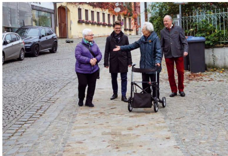
Fußgängerfreundliches Pflaster: Laufstreifen erleichtern Älteren und Menschen mit Behinderung das Gehen durch die Altstadt.