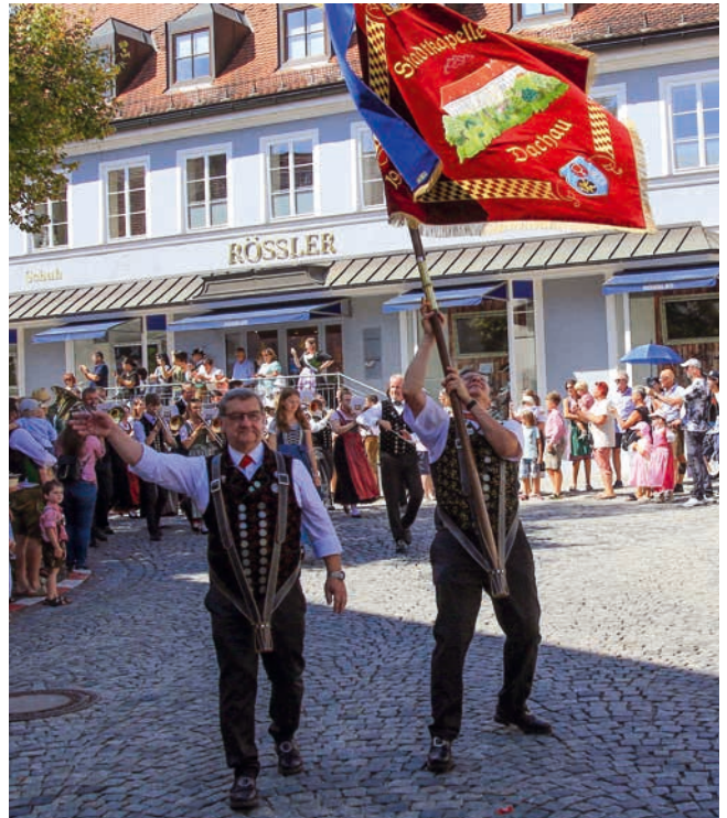
Großer Andrang: Beim Aufzug zum Volksfest säumten wieder Tausende die Straßen.