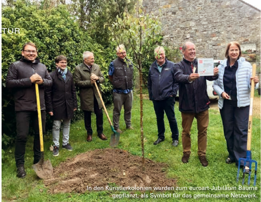
In den Künstlerkolonien wurden zum euroart-Jubiläum Bäume gepflanzt, als Symbol für das gemeinsame Netzwerk.

euroart feierte im Jahr 2024 sein 30-jähriges Bestehen – anlässlich dieses runden Geburtstages trafen sich die Mitglieder des Verbandes europäischer Künstlerkolonien im Herbst in Barbizon, also jenem ikonischen Ort in Frankreich, an dem die Freiluftmalerei ihren Ursprung nahm.