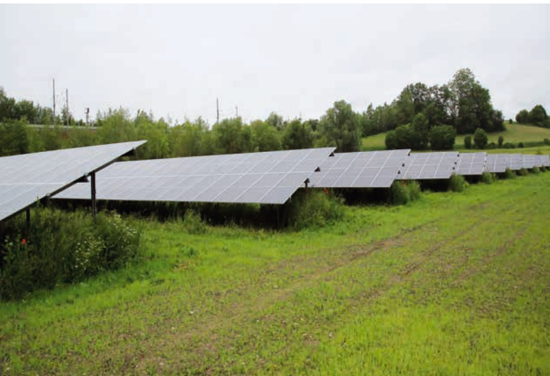
Energieerzeugung vor Ort: Im Frühjahr ging eine Photovoltaikanlage der Stadtwerke in Betrieb.