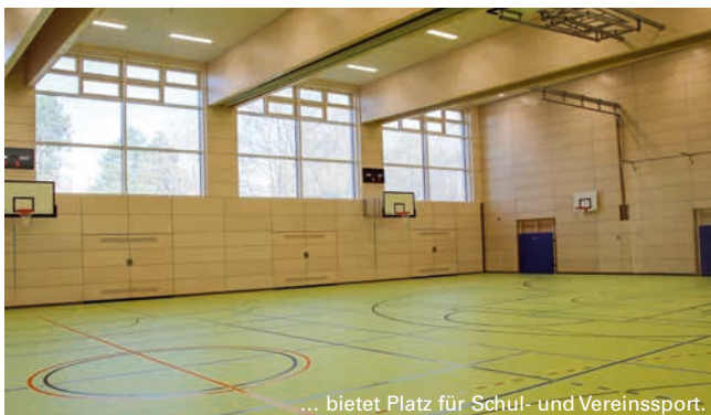
... bietet Platz für Schul- und Vereinssport.

Spatenstich zum Neubau, der die alte und marode Einfach-Turnhalle ersetzt, war im Januar 2023. Herzstück der modernen Halle sind die drei Spielfelder, die sich bei Bedarf zu einem großen Feld kombinieren lassen. Ein Konditions- sowie ein Multifunktionsraum – er ist durch eine Trennwand in zwei gleichwertige Räume teilbar – finden sich im Gebäude ebenso wie drei zusammenhängende Geräteräume, Umkleiden mit Duschen und WCs (teils für Inklusion), Besuchertoiletten, Aufzug für einen barrierefreien Zugang in alle Bereiche, Erste-Hilfe-Raum