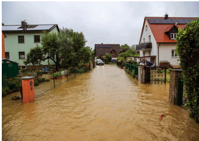
Schlimmstes Hochwasser seit vielen Jahren: Auch in Dachau standen Straßen und Keller unter Wasser.